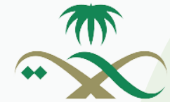
وزارة الصحة Ministry of Health